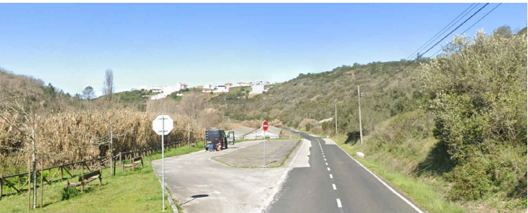
Área de Intervenção (AI) 22 - EM 606-1 - Carvalhal