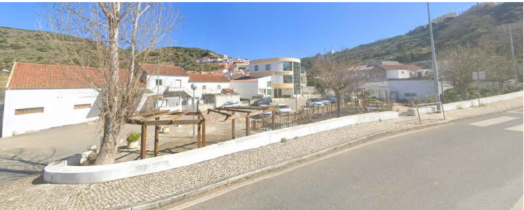
Área de Intervenção (AI) 21 - Largo da Sociedade - Carvalhal