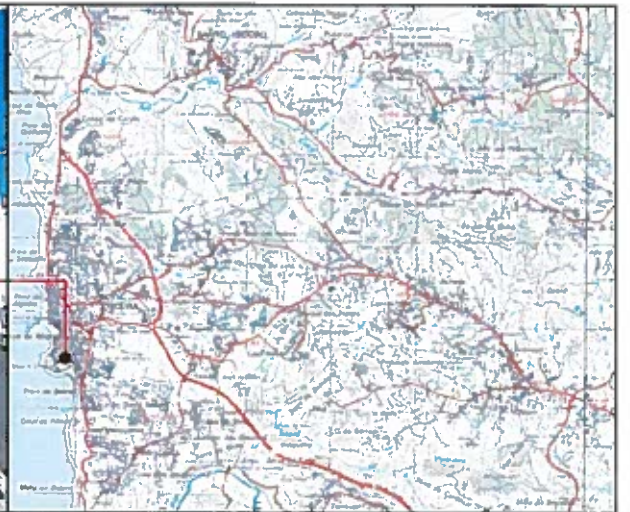
CARTA MILITAR 2009